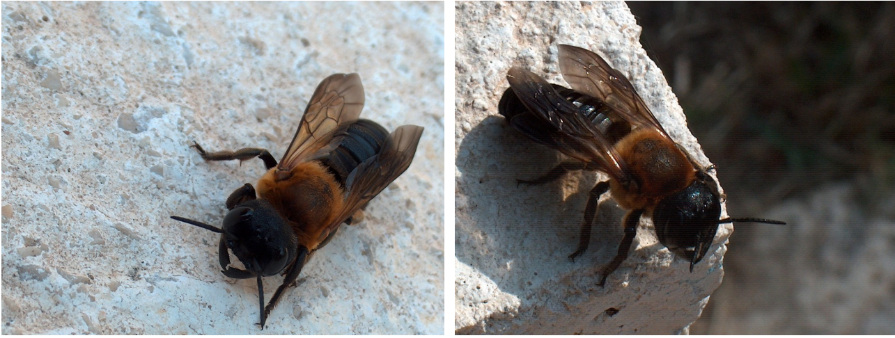
Figure 2. Femelle de Megachile sculpturalis (Hymenoptera, Megachilidae), 2.VII.2008, Allauch (France)

femelles de M. pluto nidifient dans les termitières et utilisent leurs extraordinaires mandibules pour récolter de la résine et des fibres végétales qui serviront de base à l'élaboration des cellules larvaires (Messer 1984). La biologie et la taille de M. sculpturalis lui ont valu le surnom de «giant resin bee» aux Etats-Unis où un programme de suivi de son expansion géographique est en place depuis la fin des années 1990. L'espèce semble être largement polylectique (Mangum & Sumner 2003).