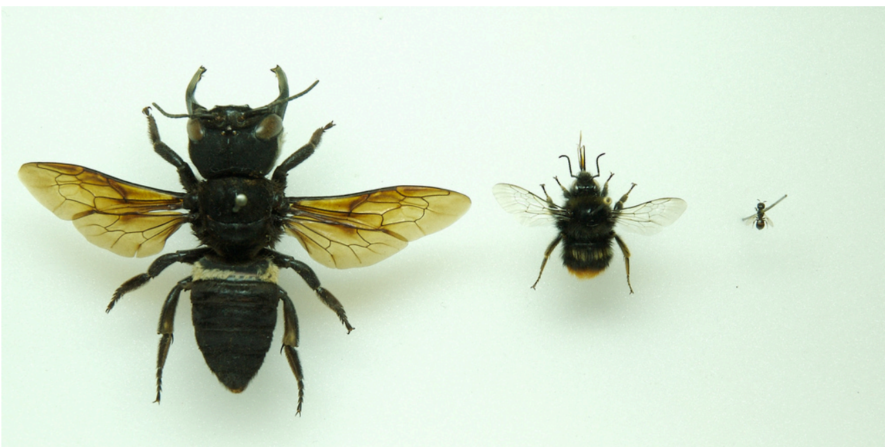
Figure 3. Megachile (Callomegachile) pluto SMITH (Hymenoptera, Megachilidae) (gauche), mâle de Bombus ruderarius (MÜLLER) (Hymenoptera, Apidae) (centre) et femelle de Ceratina parvula SMITH (Hymenoptera, Apidae). Le spécimen de M. pluto photographié est le type récolté par Alfred Russel WALLACE en Indonésie et conservé dans la collection entomologique du Musée de l'Université d'Oxford (Angleterre).