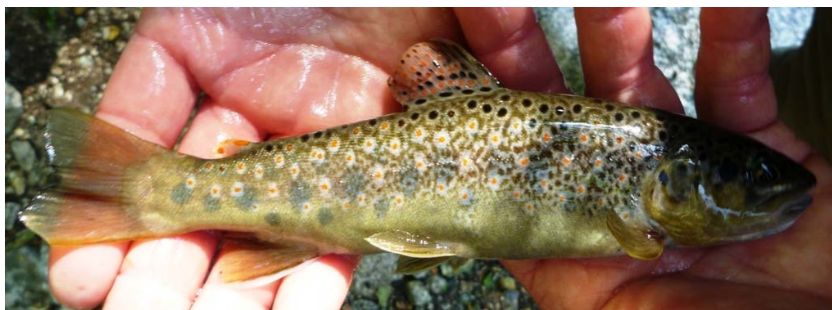
Photo : Truite d'Aqua d'Acelli, seule station de truites purement sauvages de la campagne OEC2013

Il faut souligner que la différenciation corse/méditerranéen n'est pas facile avec les microsatellites. La première raison en est la proximité génétique de ces deux types (voir ellipses bleue et verte de la Figure 1). L'autre raison est l'histoire commune de ces deux lignées, la forme corse ancestrale ayant été envahie il y a 15000 ans par la forme méditerranéenne, produisant des hybrides tout autour de l'île, à l'exception des amonts de cours d'eau limités par une chute d'eau infranchissable. Il est à présent difficile d'attribuer à chaque allèle (variant) microsatellite une origine corse ou méditerranéenne.